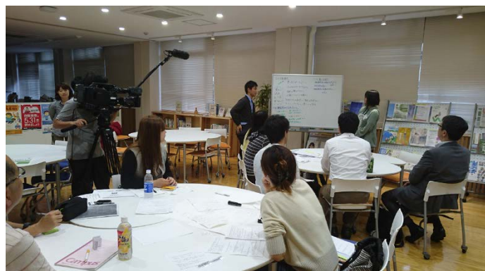
五十嵐講師による現地調査後の報告会