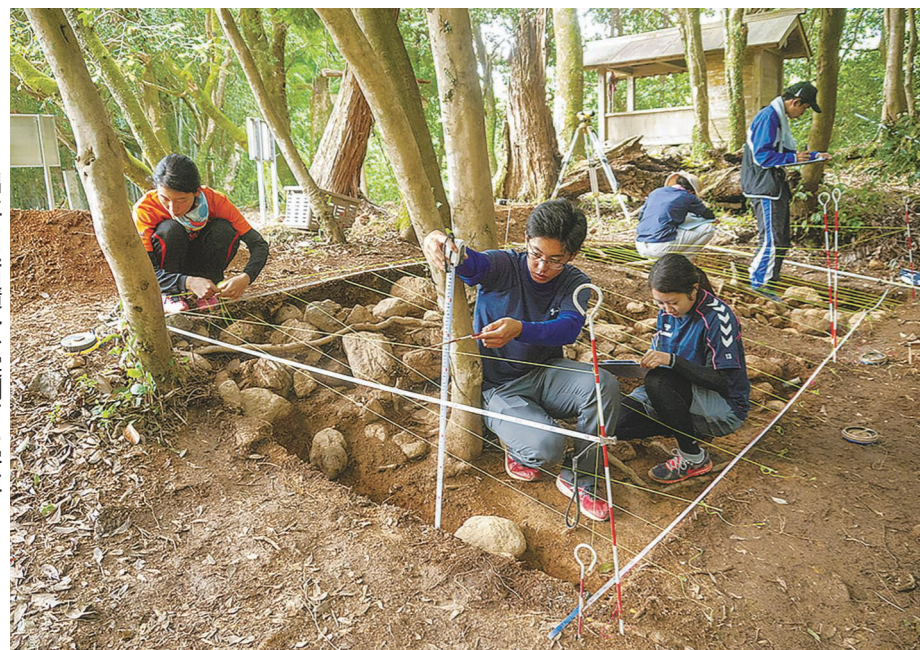
出土した石積みを実測する様子