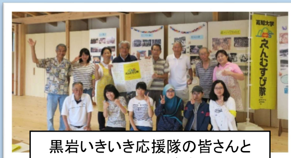
黒岩いきいき応援隊の皆さんと 過去のえんむすび隊参加者

「学生教育研究災害障害保険および学研災付帯賠償責任保険」または「大学生協生命共済および学生賠償責任保険」、「その他の保険」に加入していることが参加条件になります。未加入者は、高知大学地域連携課 地方創生推進係 (088-844-8293、kt10@kochi-u.ac.jp)にご相談ください。